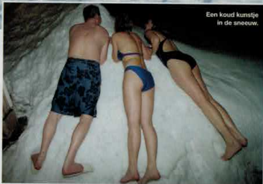
Een koud kunstje in de sneeuw.

Mijn dag kan helemaal niet meer stuk wanneer we na het paardrijden een bezoek brengen aan de Sami, ook bekend