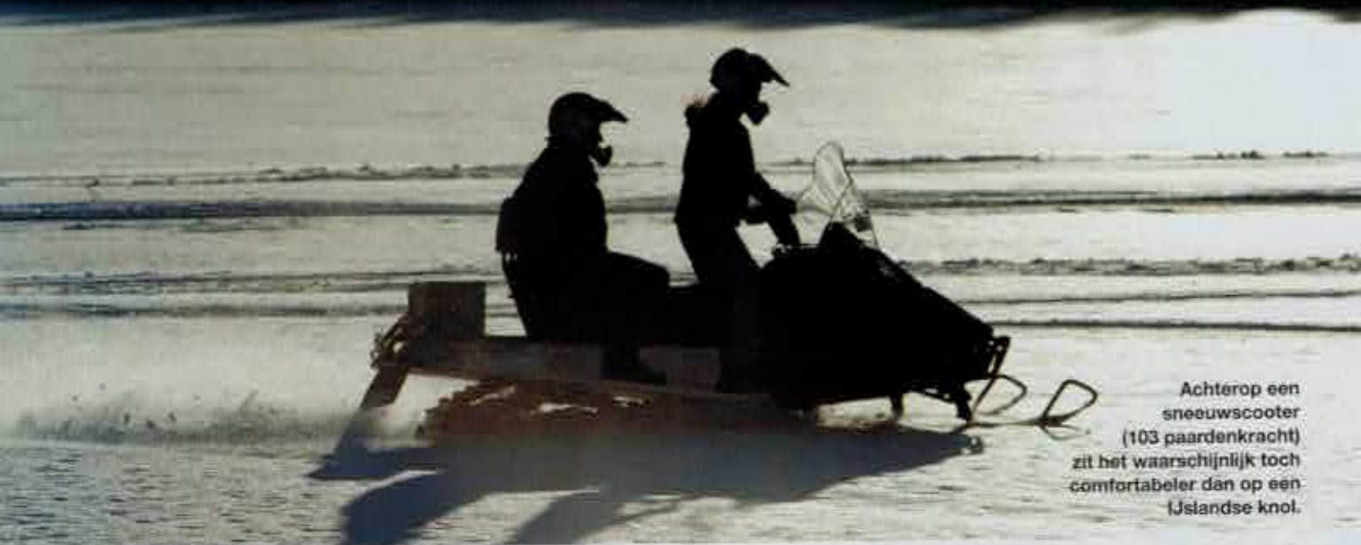
Achterop een sneeuwscooter (103 paardenkracht) zit het waarschijnlijk toch comfortabeler dan op een IJslandse knol.

W e zijn op weg naar Lapland om te gaan paardrijden in de ongerepte Zweedse sneeuw. Ik heb het niet op paarden.