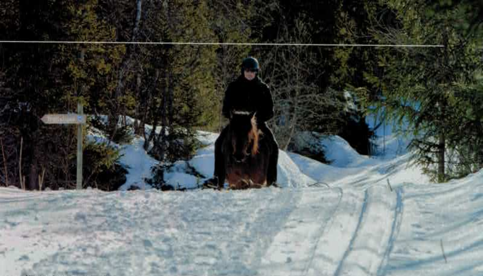
Nogmaals onze cowboy in actie. Move em on, head em up, Rawhide!