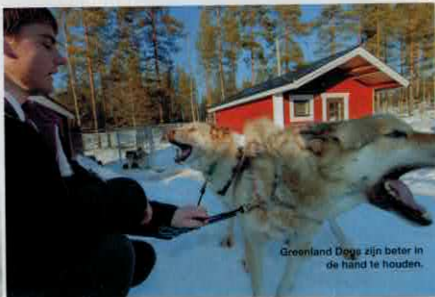
Greenland Dogs zijn beter in de hand te houden.

Het landschap is eentonig. Veel sneeuw, eindeloze wouden vol berken en naaldbomen, blauwe lichten en bevroren meren. Hier en daar een traag rondcirkelende roofvogel. Zo nu en dan een