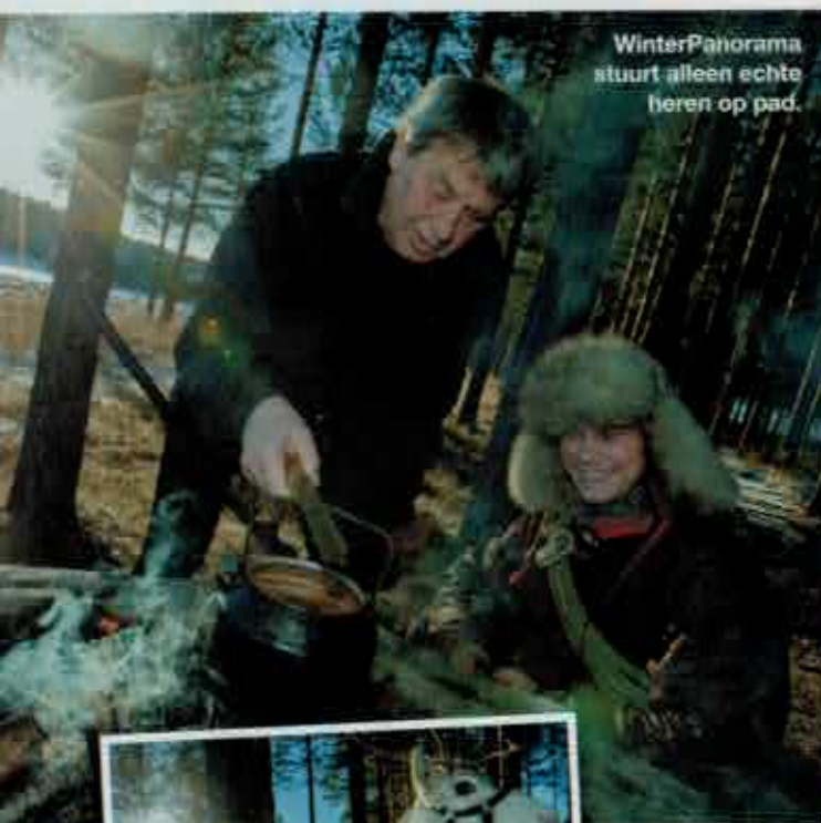
WinterPanorama stuurt alleen echte heren op pad.

Het paard dat buiten op mij staat te wachten, is ongeveer 1,40 meter hoog. Klein, maar niet zo klein dat mijn voeten door de sneeuw slepen. Dat had er te lullig uitgezien op de foto. Ze heet