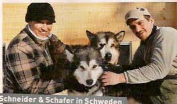
Schneider & Schafer in Schweden