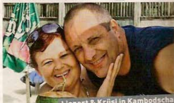
Lienert & Krüsi in Kambodscha